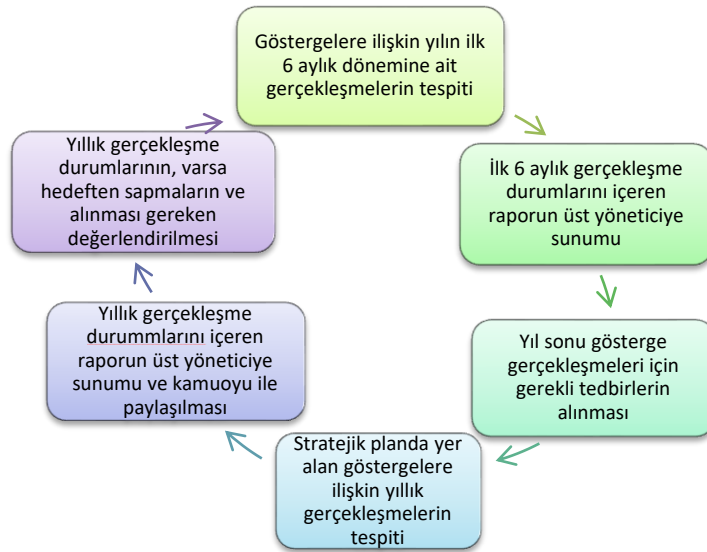
Tablo 42: Stratejik Plan İzleme ve Değerlendirme Süreci Tablosu